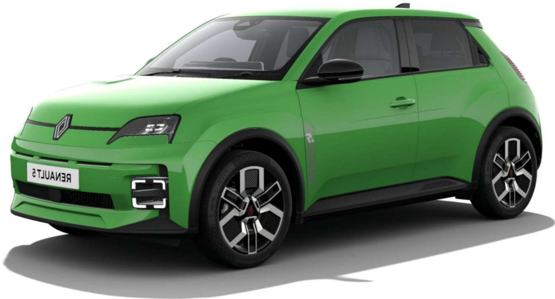
RENAULT Renault 5 E-Tech 100% electric