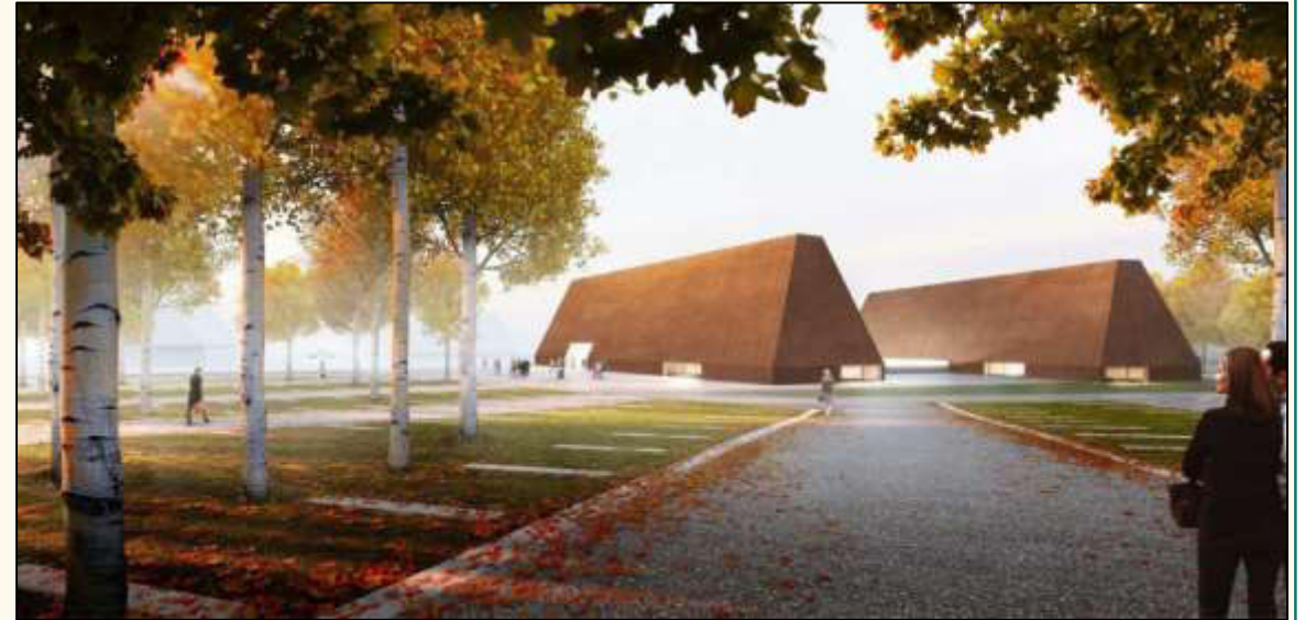
Grafik: Stiftung Landesmuseen S-H